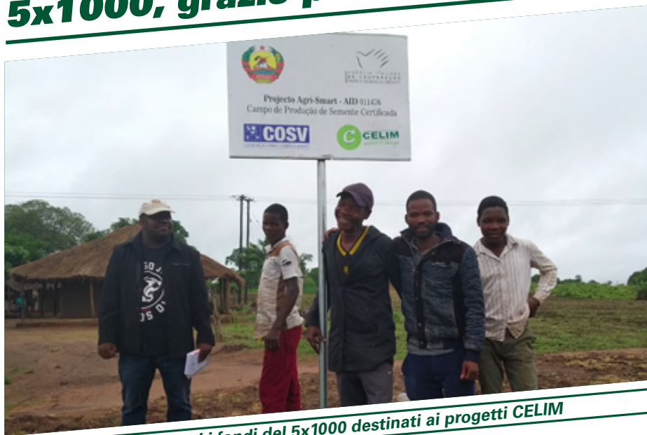
Nel 2019 sono aumentati i fondi del 5x1000 destinati ai progetti CELIM

Grazie. Mille volte grazie. Nel 2019 (ultimo dato disponibile), attraverso il meccanismo del 5x1000 , 276 contribuenti hanno donato a CELIM 17.824,18 euro. Un risultato ottimo. L'anno precedente la nostra Ong aveva ricevuto 15.065,84 e i donatori erano stati 257.